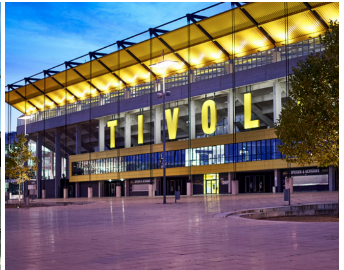
Abendveranstaltung Tivoli Business & Events Krefelder Str. 205 52070 Aachen