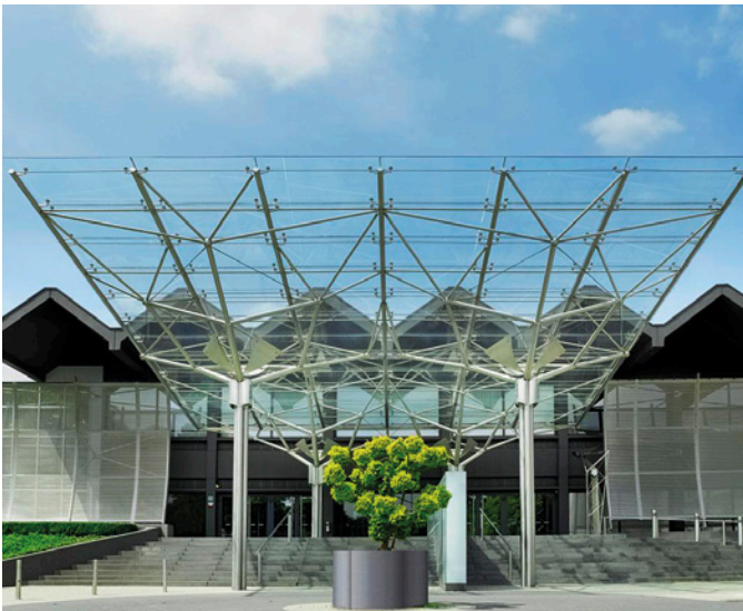
Veranstaltung Eurogress Aachen Monheimsallee 48 52062 Aachen